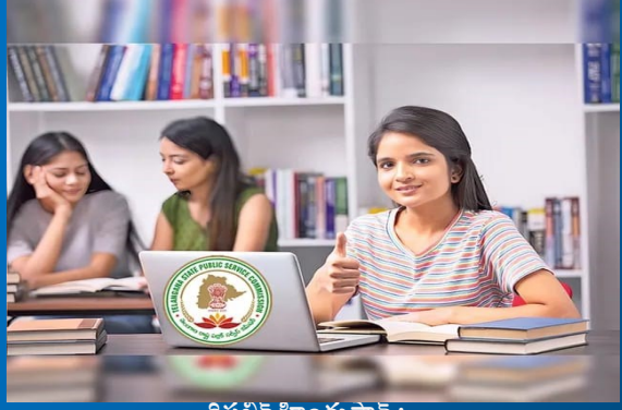
రిపబ్లిక్ హిందుస్తాన్ :

తెలంగాణ రాష్ట్రంలో గ్రూప్-2 హాల్ టికెట్లు విడుదలయ్యాయి. గ్రూప్-2 పరీక్షలు డిసెంబర్ 15, 16 తేదీల్లో జరగనున్నాయి. ఈ మేరకు రాష్ట్రవ్యాప్తంగా అధికారులు 1368 కేంద్రాలను ఏర్పాటు చేశారు. తాజాగా గ్రూప్-2 పరీక్షలకు సంబంధించి హాల్ టికెట్లను TSPSC విడుదల చేసింది. గ్రూప్-2 ఉద్యోగాలకు రాష్ట్రవ్యాప్తంగా సుమారు 5.51 లక్షల మంది దరఖాస్తు చేసుకున్నారు. అభ్యర్థులు హాల్ టికెట్లను https://websitenew.tspc.gov.in/ లింక్ను క్లిక్ చేసి డౌన్లోడ్ చేసుకోవచ్చు.